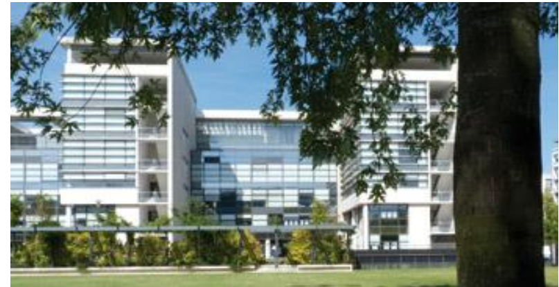
Faculté de Droit, Economie, Gestion d'Angers

« Recueil de données épidémiologiques en médecine générale, santé publique et santé au travail »