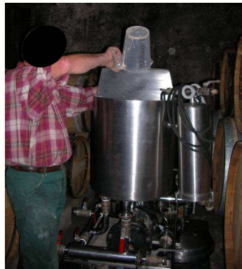
Exposition lors de la phase d'alluvionnage continu nécessitant l'alimentation au pichet de la cuve en terres de diatomées

La démarche de prévention a consisté à informer et aider à identifier le danger. Des moyens de prévention organisationnels, techniques ainsi que des moyens de protection collective et individuelle ont été proposés mais leur mise en place s'est avérée difficile dans le contexte d'une petite entreprise